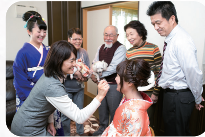
感動の一幕を見守る家族の笑顔。