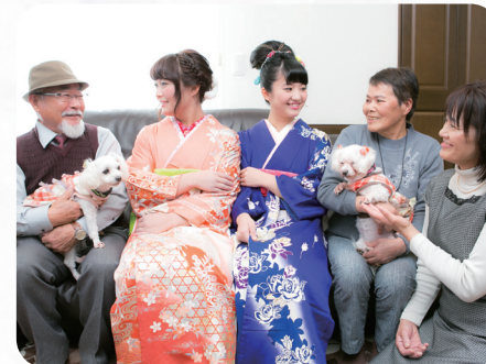
孫の成長ありがとう。大好きなワンちゃんも、はいポーズ!